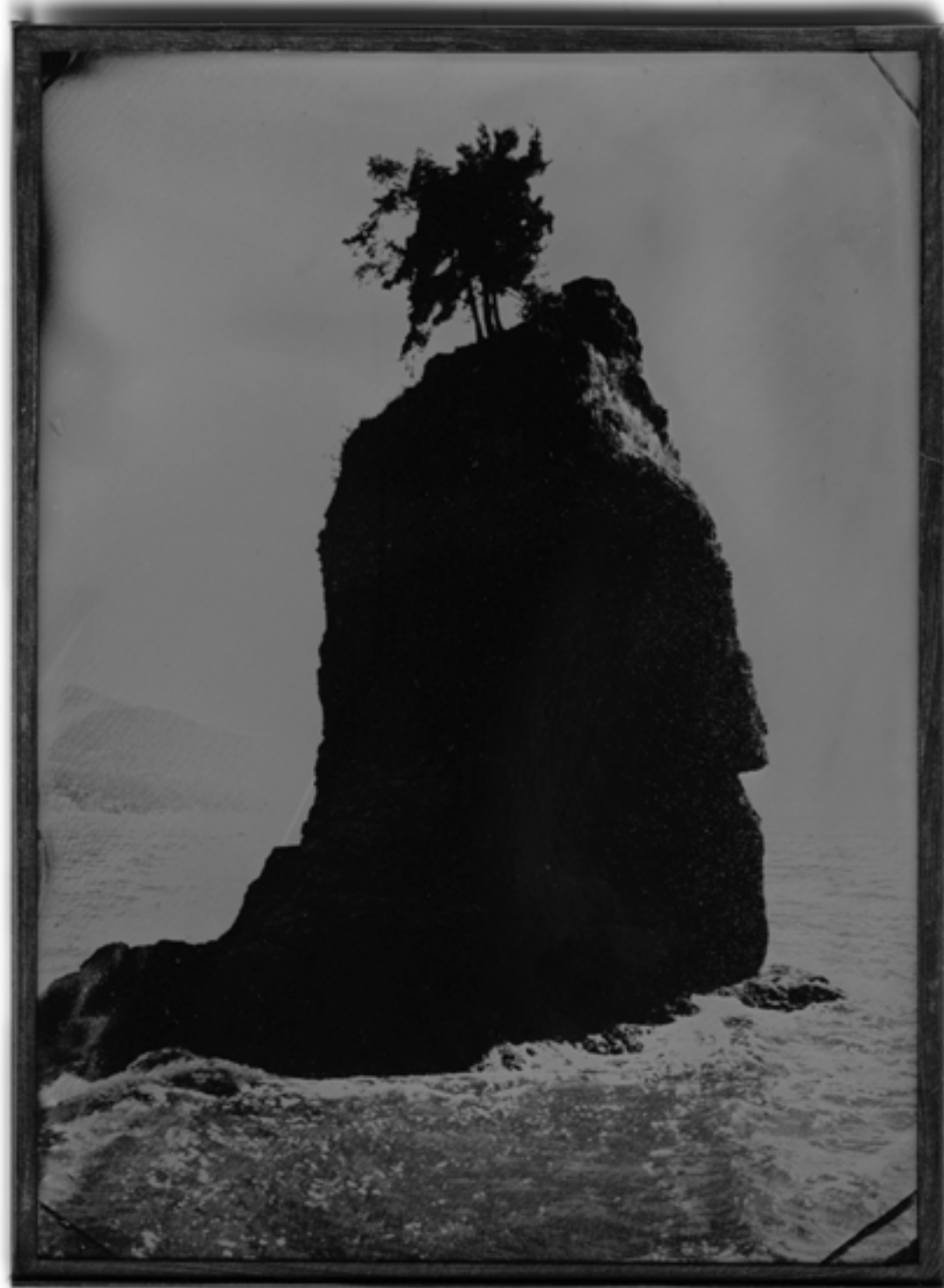
SAMANÁ, RD. 1940