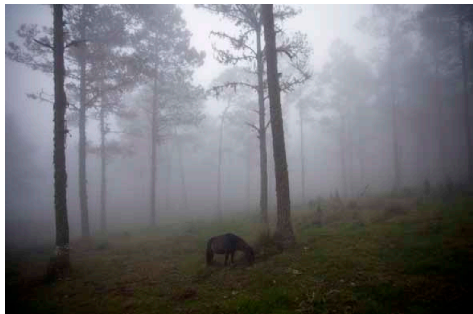
VANCOUVER, CANADÁ. 2010 IMPRESIÓN ELECTRÓNICA OBTENIDA POR INYECCIÓN DE TINTA 16,5 X 25 CM.