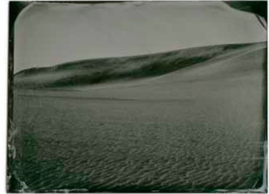
DUBAI, EMIRATOS ÁRABES. 1923