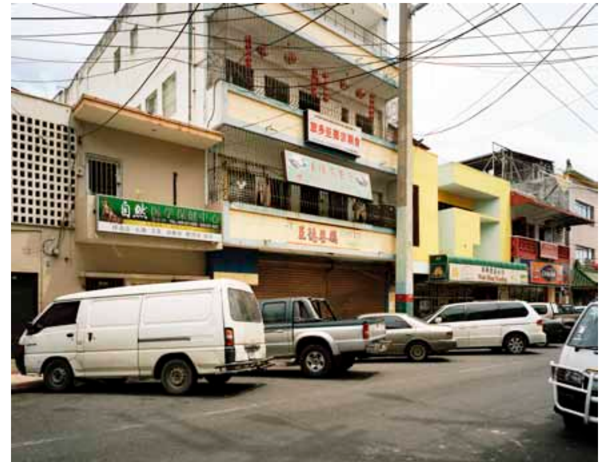
SANTO DOMINGO, RD. 2010

A partir de imágenes históricas del Archivo Nacional de la República Dominicana, de fotografías domésticas y algunas otras imágenes tomadas durante el encuentro, el trabajo se conforma como una reflexión sobre los límites de la fotografía, desde el cuestionamiento de sus fuentes, su valor de uso y, en definitiva, su veracidad. La obra, formada por 47 fotografías de dimensiones variables, se enfrenta a este diálogo. Las imágenes cuentan historias de