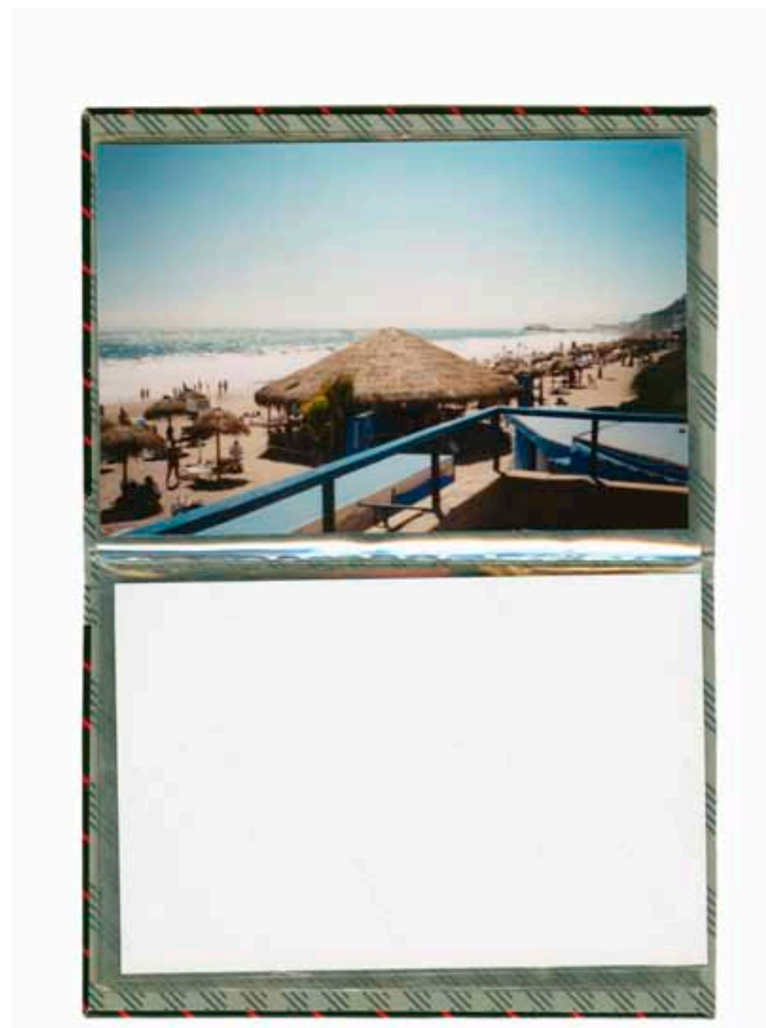
BÁVARO. LA ALTAGRACIA, RD. 1990 FOTOGRAFÍA COLOR DE REVELADO CROMÓGENO 10 X 15 CM.