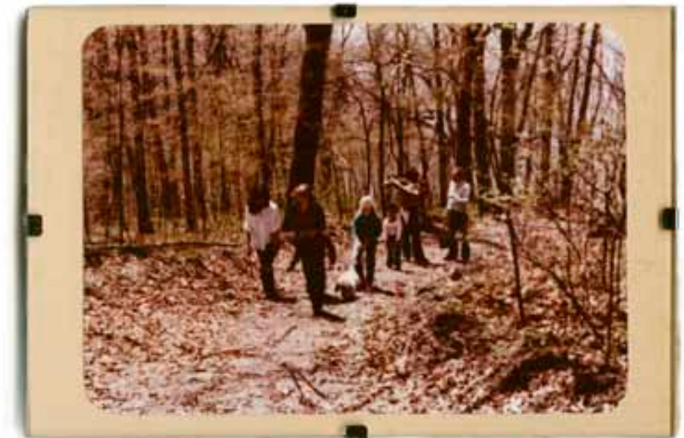
JARABACOA. LA VEGA, RD. 1982