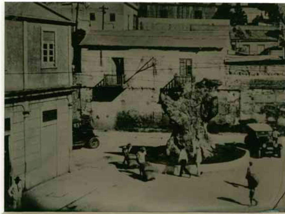
CEIBA DONDE COLÓN AMARRÓ SU CARABELA. SANTO DOMINGO, RD. 1915