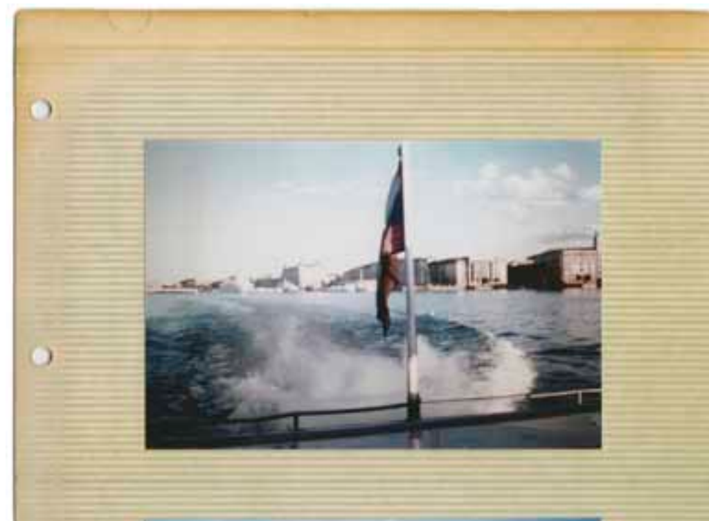
CABO HAITIANO, HAITÍ. 11-01-10 FOTOGRAFÍA COLOR DE REVELADO CROMÓGENO 10 X 15 CM.