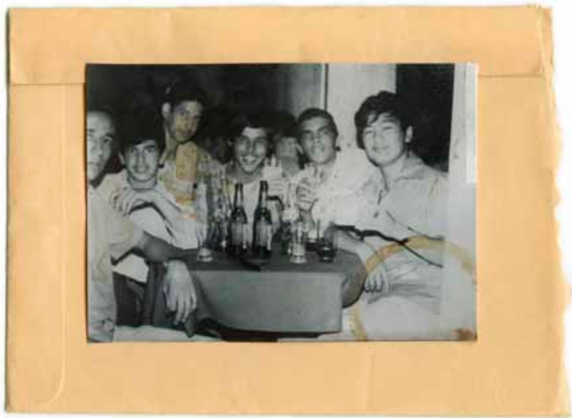
SAN FRANCISCO DE MACORÍS. DUARTE, RD. 1971 FOTOGRAFÍA AL CLORURO-BROMURO DE PLATA 9 X 13 CM.