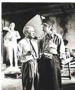
Lee Miller et Picasso, Libération de Paris, 1944.