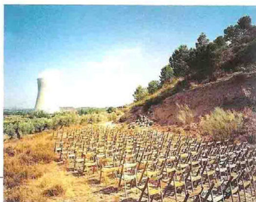
A GAUCHE : Espectadores #12. A DROITE : Espectadores #6. © Aleix Plademunt.