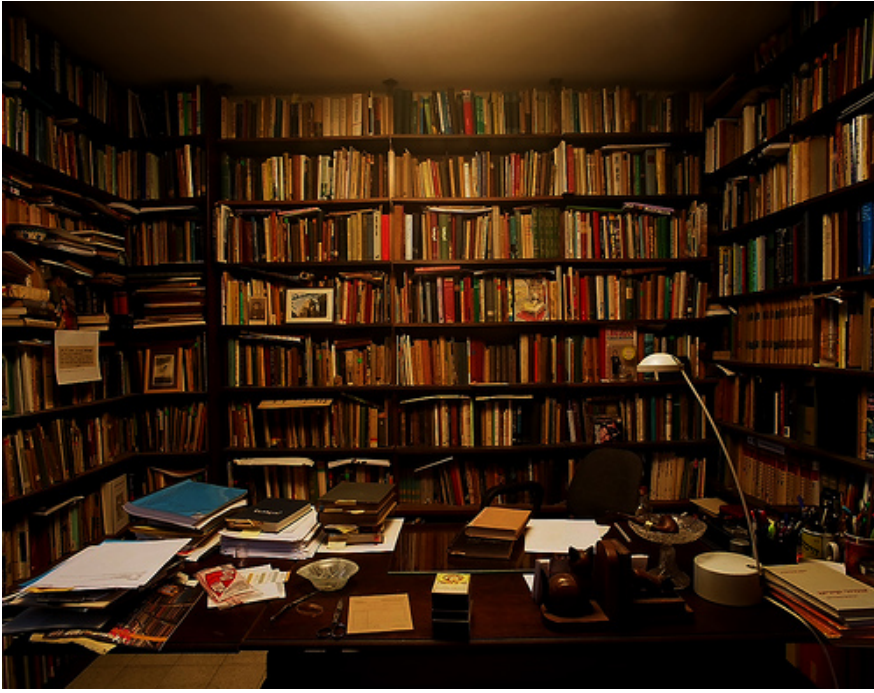
série author's spaces ( haim be'er ), c-print, ed.6, 100 x 120 cm