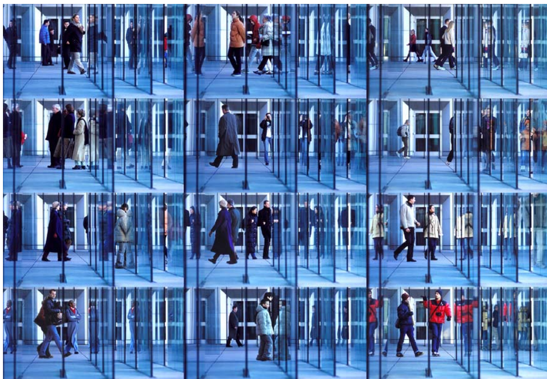
Labyrinthe (détail) - tirage Lambda - 100x250cm - édition de 5 - 2003