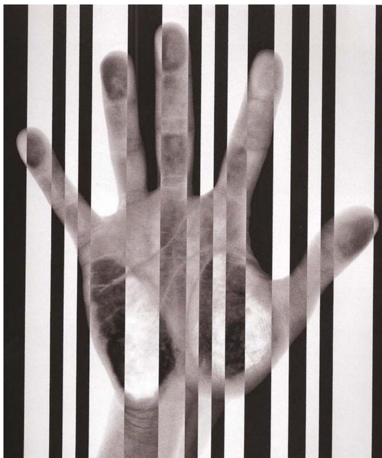
Passerelle II - tirage Lambda – 125x105cm - édition de 5 - 2003