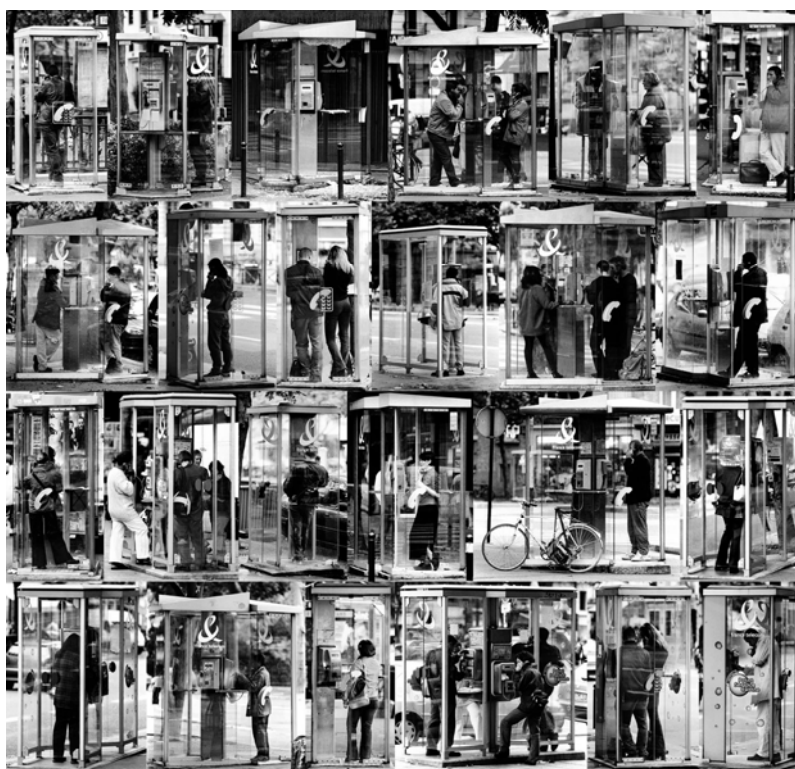
Cabines - tirage Lambda – 100x104cm - édition de 5 - 2001