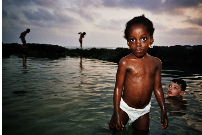
Odélie - série Lomo – c-print, ed.6